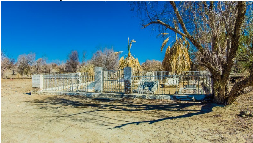
Der Friedhof in Bethanien