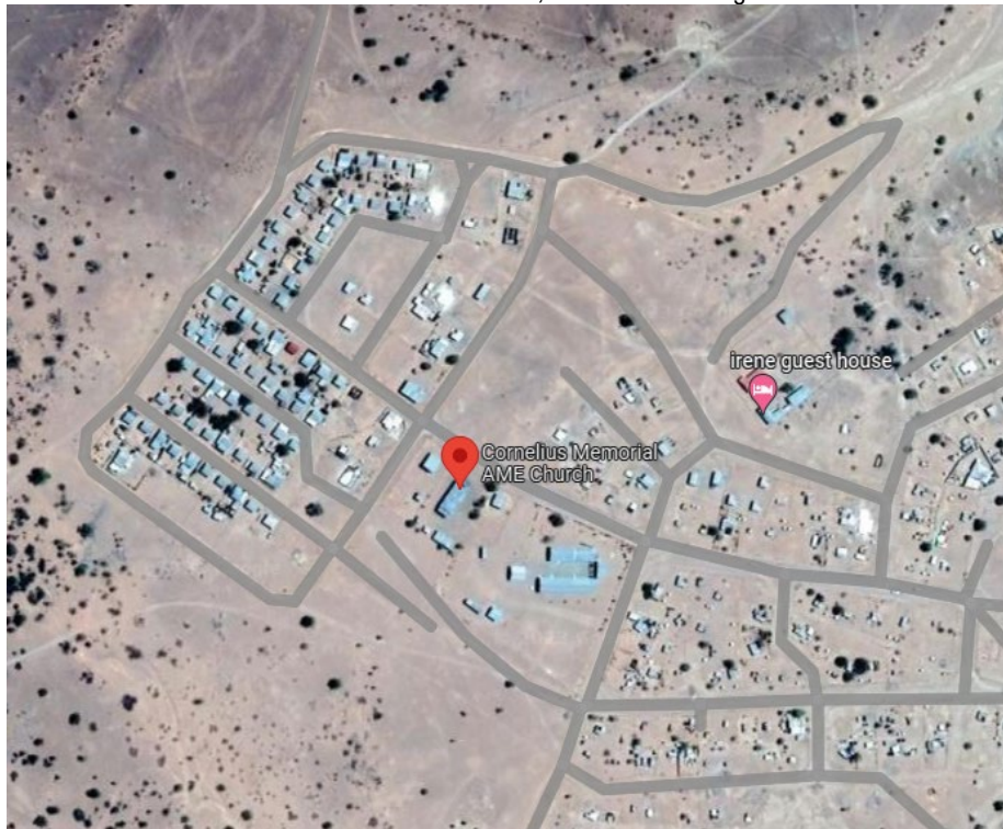
Dieser Ausschnitt aus Google Maps veranschaulicht die Lage der Kirchen!