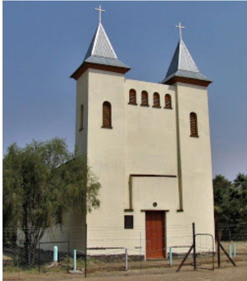
Hier sieht man die renovierte Kirche, die nun ein Schulgebäude ist!

Neben der alten Kirche mit den Doppeltürmen liegt der kleine Friedhof mit Gräbern einiger Missionare und ihrer Familienangehörigen. (Siehe zum Beispiel auch das Grab Lydias). Die weiße Kirche wurde Ende des 20. Jahrhunderts aufwändig renoviert und die beiden historischen Türme wieder errichtet.