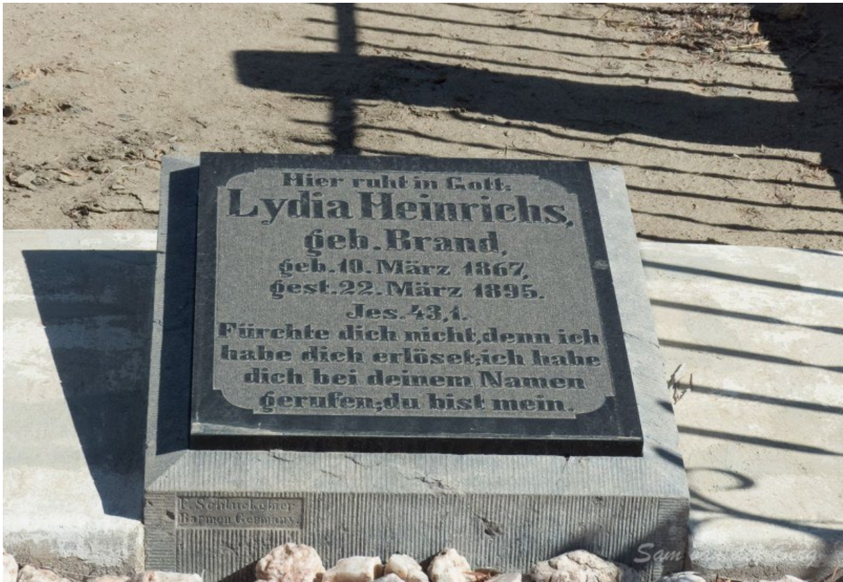
Das Grab Lydias kann noch heute in Bethanien besucht werden